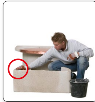
7 Auf das Feuerraumteil punktuell von dem angemischten Kleber aufbringen.