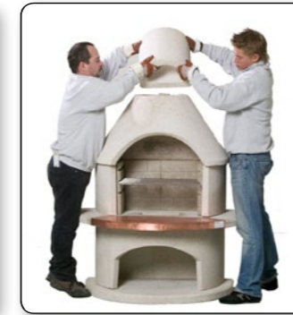
18 Kamin Aufsatz auf die Haube aufsetzen.