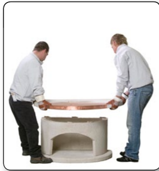
6 Simsplatte hinten bündig und seitlich mittig auf das Holzraumteil aufsetzen.