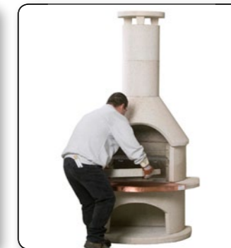
23 Feuerbetoneinsatz im Feuerraumteil positionieren.