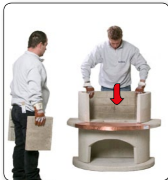
10 Den 3-teiligen Feuerbetoneinsatz von oben senkrecht in das Feuerraumteil einsetzen.