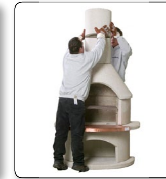
20 Zweiten Kamin Aufsatz positionieren.