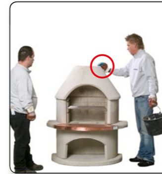
17 Wiederum punktuell den angemischten Kleber aufbringen.