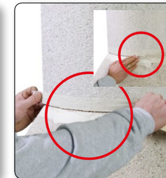
24 Die Fugen zwischen den Kamin Aufsätzen gleichmäßig rundum mit Klebeband abkleben und gleichmäßig mit dem Kleber verputzen. Danach das Klebeband abziehen.