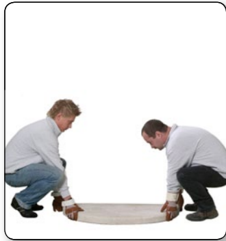
1 Bodenplatte auf festem Untergrund in die richtige Position bringen.