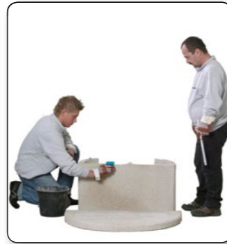
3 Auf das Holzraumteil punktuell den angemischten Kleber aufbringen.