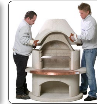
16 Haube auf das Feuerraumteil aufsetzen.