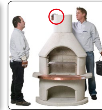
19 Auf den Kamin Aufsatz punktuell den angemischten Kleber aufbringen.