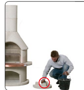
21 Auf die Füße der Kaminabdeckung punktuell angemischten Kleber aufbringen.