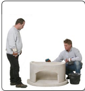
5 Auf das Holzraumteil punktuell von dem angemischten Kleber aufbringen.