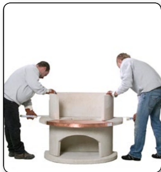
9 Die seitliche Ausrichtung überprüfen.