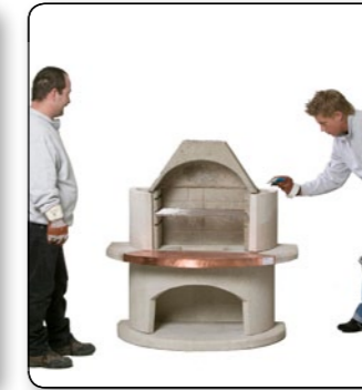
15 Auf das Feuerraumteil punktuell den angemischten Kleber aufbringen.