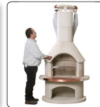
22 Kaminabdeckung auf dem zweiten Kamin Aufsatz positionieren.