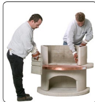
11 Auf den richtigen seitlichen Abstand achten (ca. 2 cm rundum!)