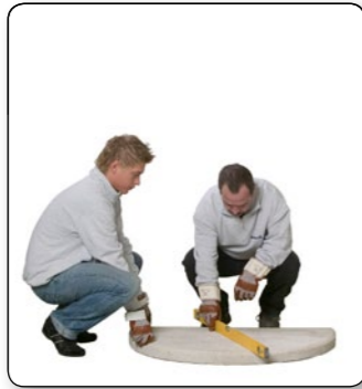
2 Waagrecht ausrichten.