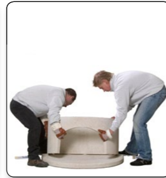
4 Holzraumteil hinten bündig und seitlich mittig auf die Bodenplatte aufsetzen.