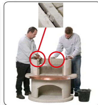
12 Den Feuerbetoneinsatz nach dem Ausrichten mit Kleber am Feuerraumteil fixieren (Detail).