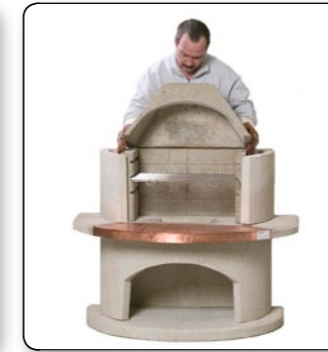
14 Feuerbetoneinsatz (Modellabhängig) auf dem Feuerbetoneinsatz positionieren.