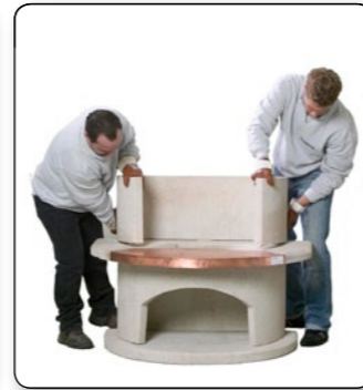
8 Feuerraumteil hinten bündig und seitlich mittig auf die Simsplatte aufsetzen.